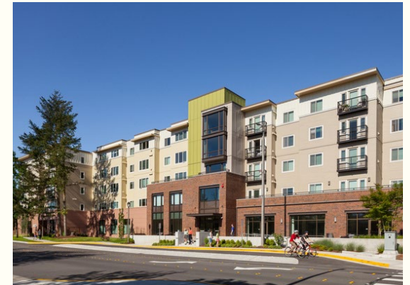
John Gabriel House - Redmond, WA. 40-60% ami