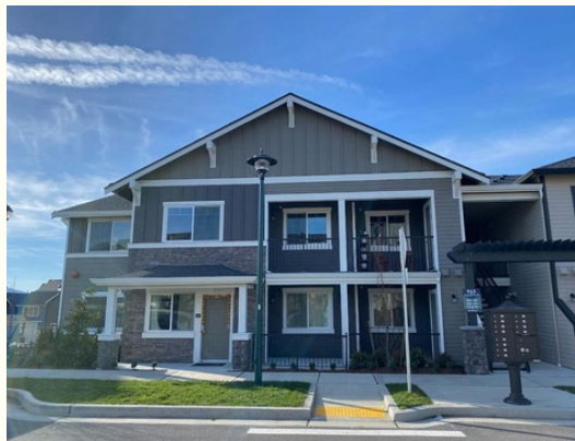
Westridge - Issaquah, WA. 80 % del AMI

Para conocer los recursos para propietarios de viviendas, visite: https://www.archhousing.org/homeowner-resources