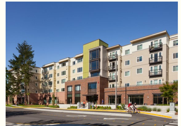
John Gabriel House - Redmond, WA. Del 40 % al 60 % del AMI