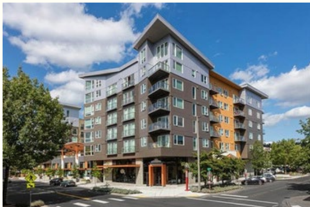
Milehouse - Redmond, WA. 80 % del AMI

Para conocer los recursos para inquilinos, visite: https://www.archhousing.org/renter-resources