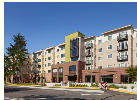
John Gabriel House - Redmond, WA. 40-60% ami